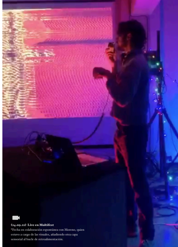
(24.09.22) Live en Multifest